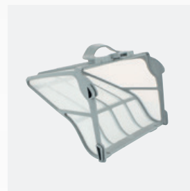
Filterkorb (60µ) Leicht zugänglich und mit großem Fassungsvermögen (5 Liter)